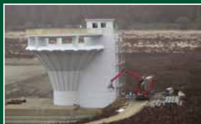
Ružiná, rekonštrukcia vodného diela