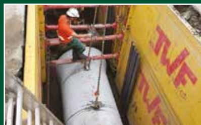
Brno, Pastrnkova II, rekonštrukcia kanalizácie