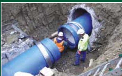
PD – Nováky – havária – oprava prívodného potrubia z VD Nitranske Rudno