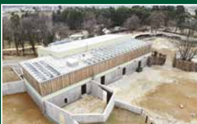
ZOO Bojnice, ubikácia africkej fauny – Nový pavilón slonov