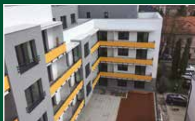
Banská Bystrica, Skuteckého ul., novostavba polyfunkčného bytového domu