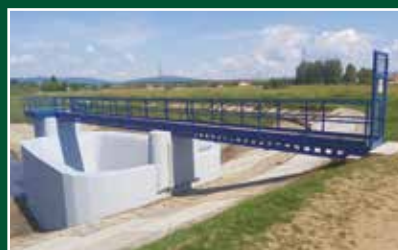
Ladovo, rekonštrukcia vodného diela